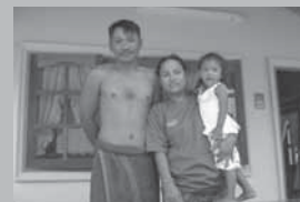
รอยยิ้มที่อบอุ่นของดำกับภรรยาและลูกสาว