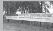
การต่อสู้ครั้งหนึ่งของชาวป่าคลองกับมหันตภัยระลอกปัจจุบัน (ภาพถ่ายจากริมอ่าวป่าคลองเมื่อวันที่ 12 กันยายน 2551)