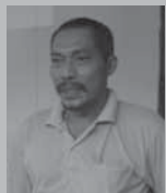
“บ้านแสน” แสบ เบซหบอ