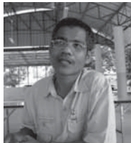
อาจารย์บะ: สามเณร

ผู้มีถิ่นกำเนิดอยู่ที่อำเภอคลองท่อม จังหวัดกระบี่ แต่จบการศึกษาระดับปริญญาตรีที่วิทยาลัยครูภูเก็ต (ปัจจุบันคือ มหาวิทยาลัยราชภัฏภูเก็ต)